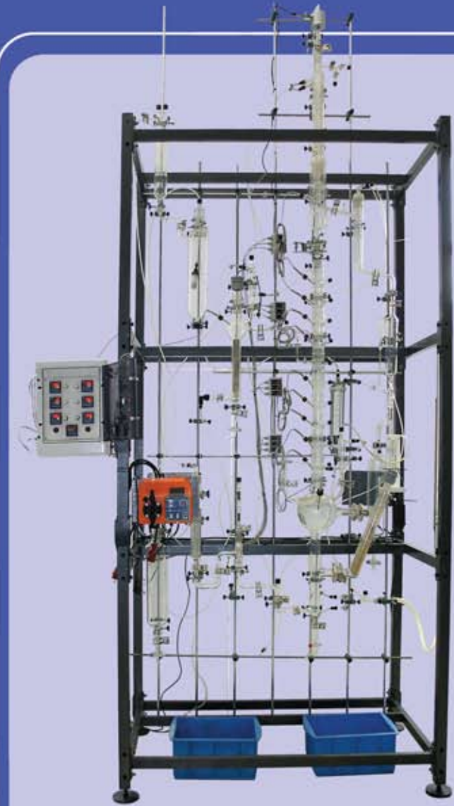
وحدة تقطير ومضي DIS101