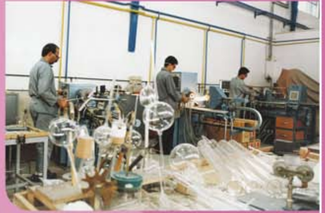
ورشة إنتاج الزجاجات المختبرية