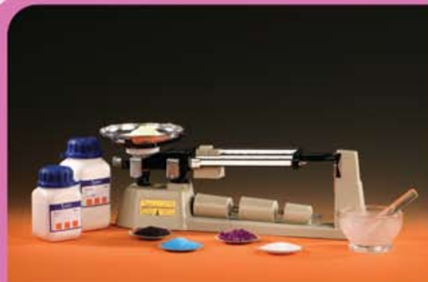
④ ميزان ثلاثي العتلة