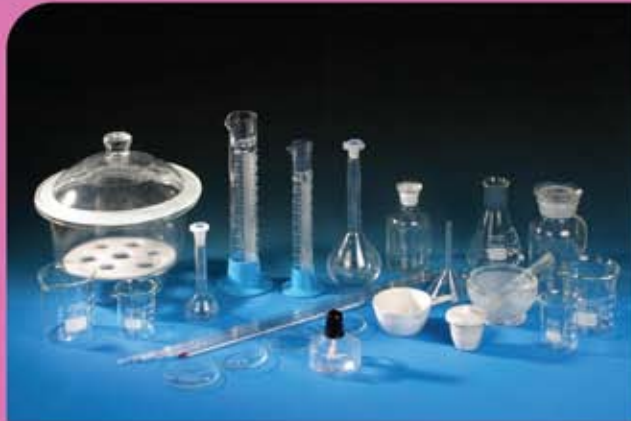
④ عدد من الزجاجات المختبرية لمجموعة الكيمياء