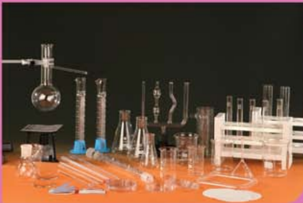
④ عدد من الادوات المختبرية لمجموعة الكيمياء