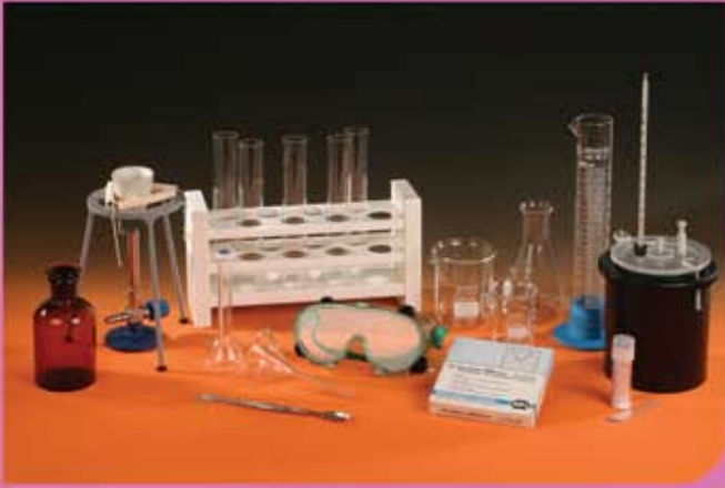
④ عدد من الادوات المختبرية لمجموعة الكيمياء

تعد الكيمياء من العلوم الوظيفية بحيث يمثل فيها الاختبار والبحث والاستنتاج دوراً مهماً للغاية. ولا يخفى على أحد مدى أهمية تجارب الطالب الفردية في استيعاب مفاهيم العلوم التجريبية. وعلى هذا الأساس فإن الطالب يستأنس بالعلوم استثناساً لا يحصل له بالأساليب النظرية البحتة وإنما يحصل له ذلك عبر إجراء الاختبارات والتجارب العلمية. مجموعة تعليم الكيمياء للمرحلة الثانوية بما فيها من 151 مادة من المستلزمات المختبرية تحظى بقبالية إجراء 30 اختباراً كيميائياً. و فيما يلي صور لعدد من أجزاء المجموعة :