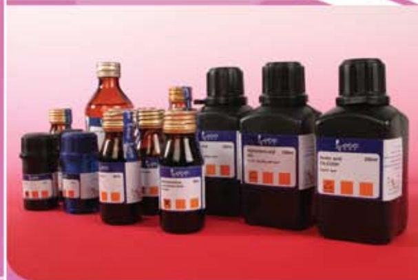
④ عدد من المواد الكيميائية الجاهزة لمجموعة الكيمياء