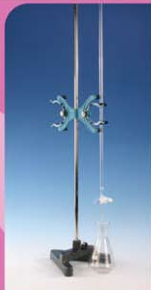
④ يورت ٢٥ ملم