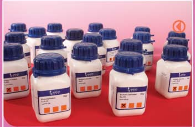
④ قسم من المواد الكيميائية الجامدة