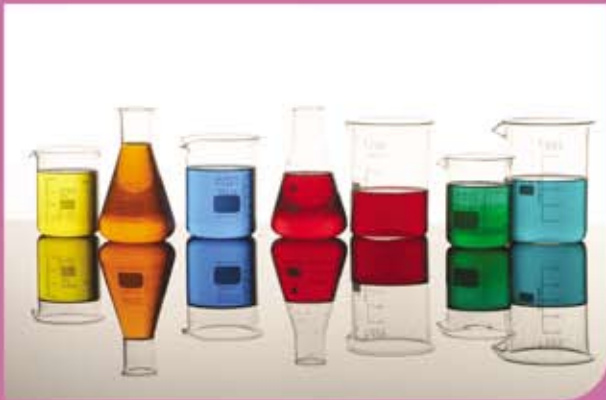
عدد من البشور، الأرن، بالون جوجيه و الاسطونات المدرجة