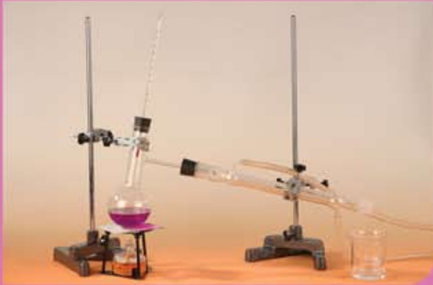
④ آلة تقطير بسيطة