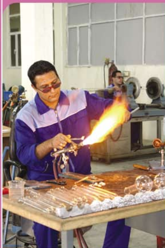
④ ورشة إنتاج الزجاجات المختبرية