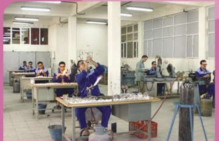
ورشة إنتاج الزجاجات المختبرية