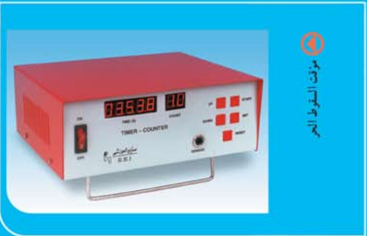
مؤقت السقوط الحر