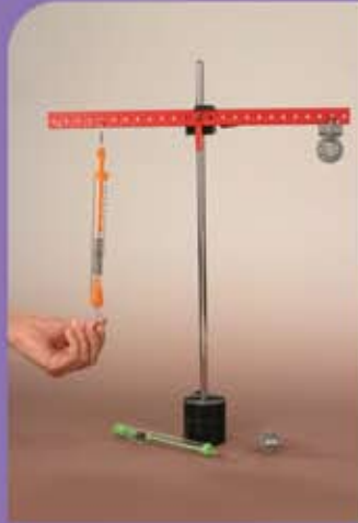
مجموعة تدريب الكهرباء الساكنة