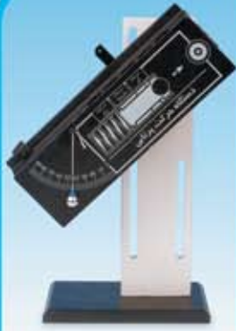
جهاز الحركة الاقانيية