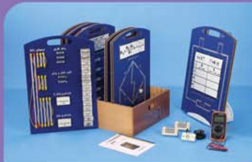
مجموعة تدريب الكهرباء اللوحية (العرضية)