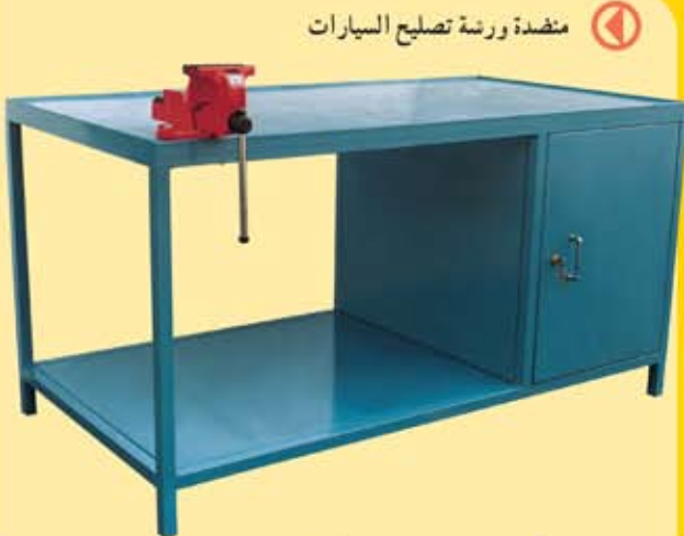
متضدة ورشة تصليح السيارات