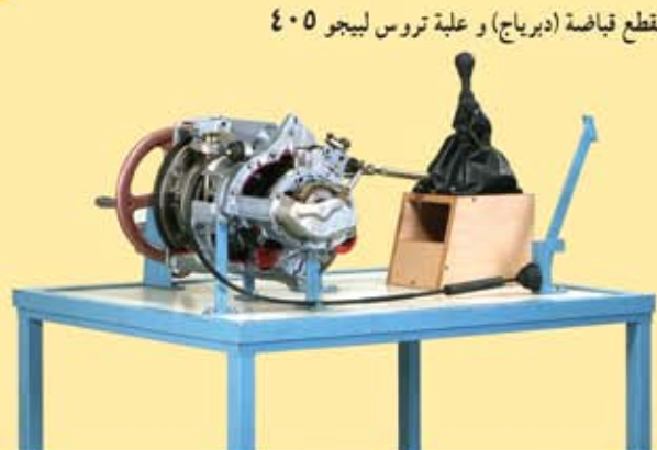
مقطع قباضة (دبرياج) و غلبة تروس لبيجو ٤٠٥