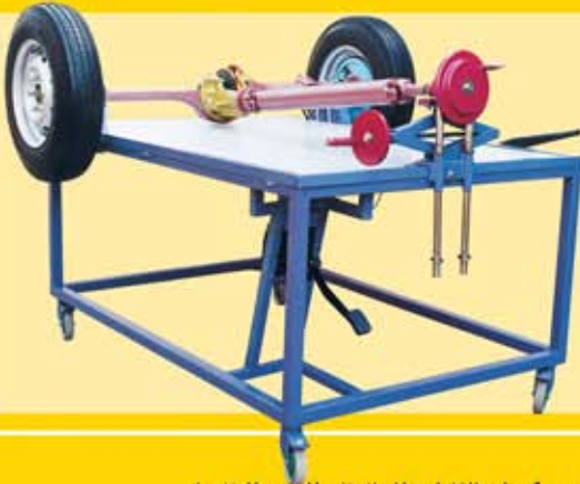
مقطع عمود كردان (الإدارة الخلفية) و الترس التفاضلي