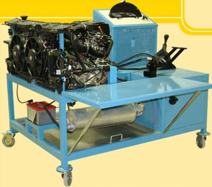
محرك حاقن لبيجو ٤٠٥ برفقة جهاز نقل القوة