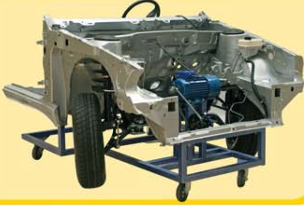
مجموعة تدريب المقود الهيدرولي و التعليق الأمامي لبيجو ٤٠٥