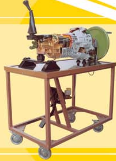
مقطع قباضة (دبرياج) و غلبة تروس و الجهاز الحركي الخلفي